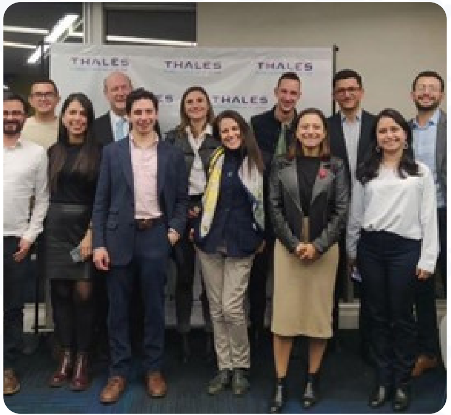
Evento FrenchTech 2023