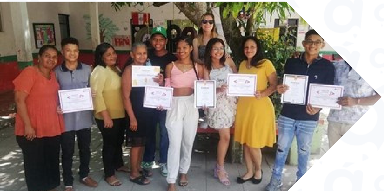
Prográmate School 2023 en Luruaco y Campo de la Cruz