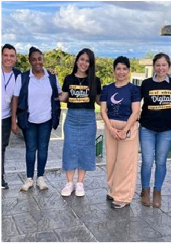
Prográmate Academy llega a Buenaventura