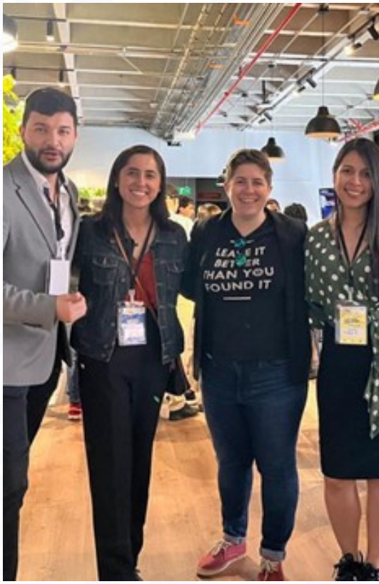
TechFest Prográmate 2023