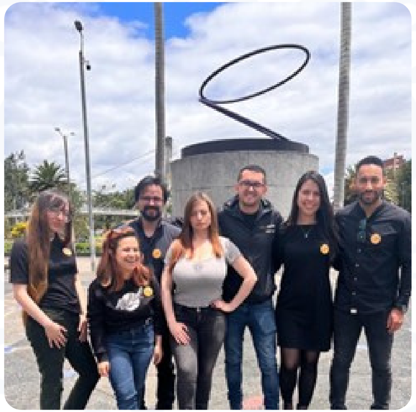
Evento lanzamiento "Mi brújula hacia el futuro"