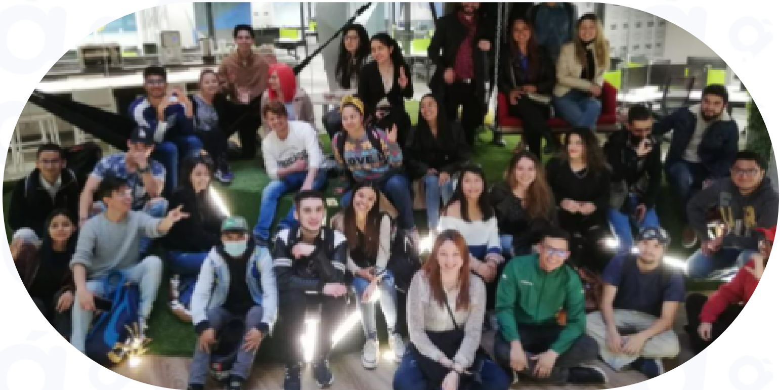
Eventos y Hackatones con egresados Prográmate Academy